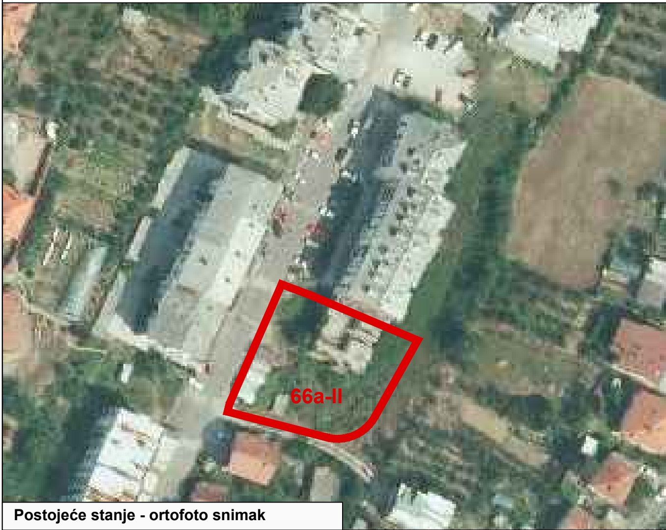
Postojeće stanje - ortofoto snimak